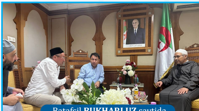
Batafsil BUKHARI.UZ saytida